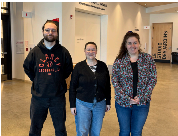
Le personnel d'accueil