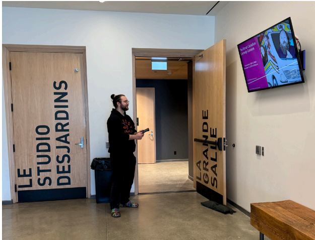
L'entrée de la Grande Salle