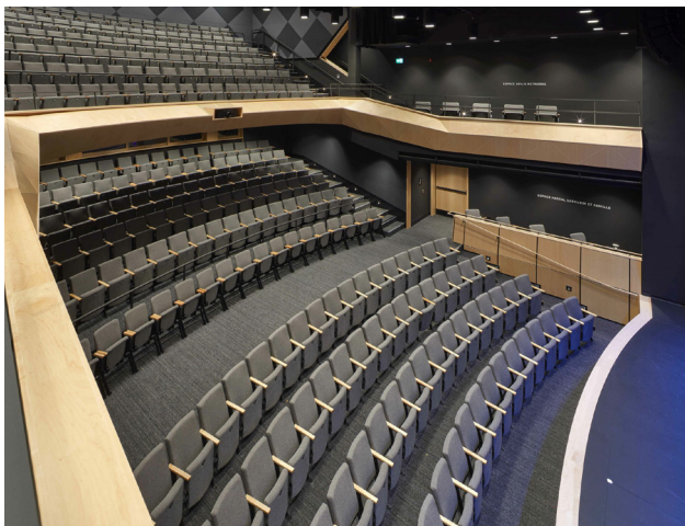
La salle de spectacle