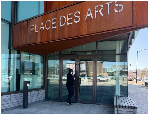
L'entrée de la Place des Arts