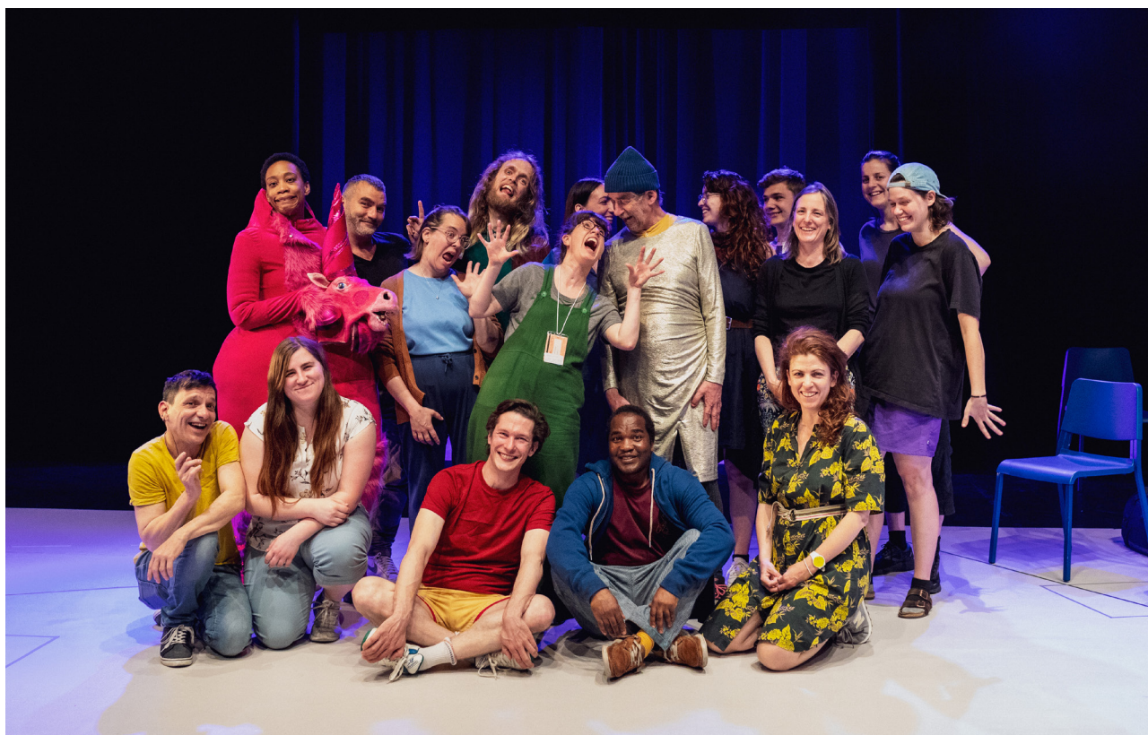
Voici une photo de toute l'équipe de Cispersonnages en quête d'auteurice .

Son numéro de téléphone est 514-279-9821 . Tu peux laisser un message sur la boîte vocale.